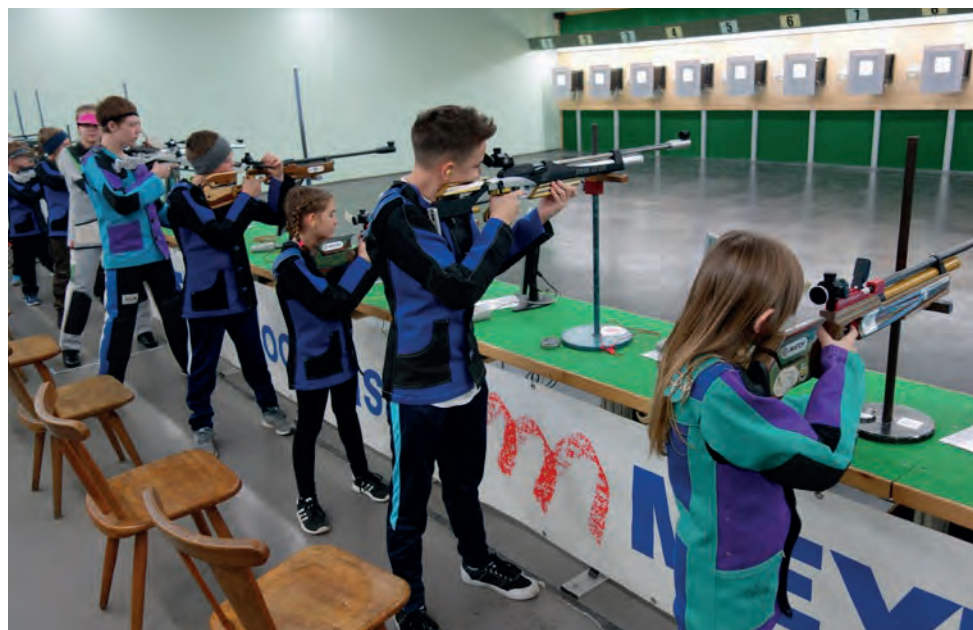
230 Schützen-/Innen aus 20 Vereinen beeindrucken mit tollen Leistungen.