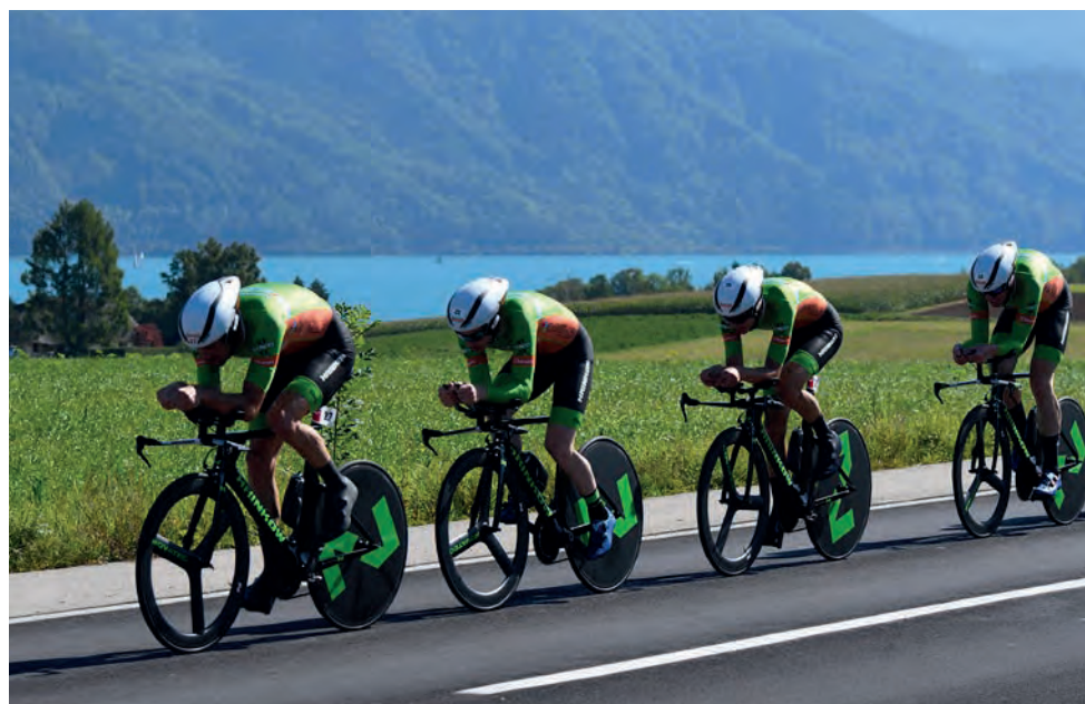
Das Ziel: die heißbegehrte Krone des "ASVÖ" King of the lake".