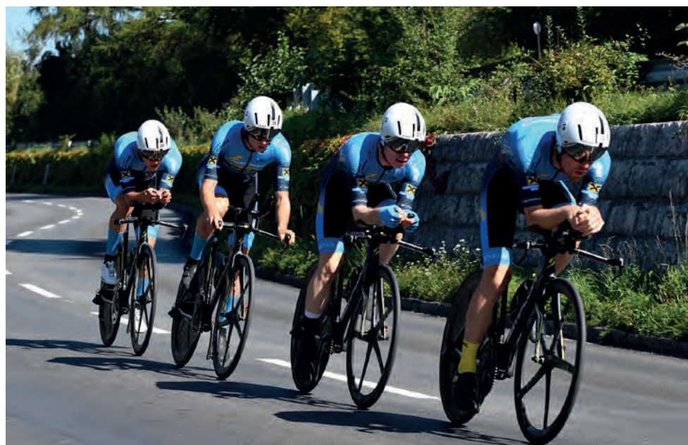
17 Nationen bezwingen die 47,2 km lange Strecke rund um den Attersee.