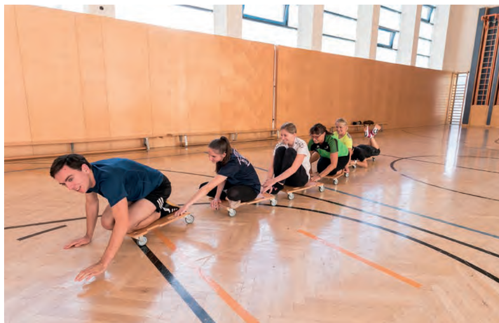
Der Spaß dabei darf aber auf keinen Fall fehlen.