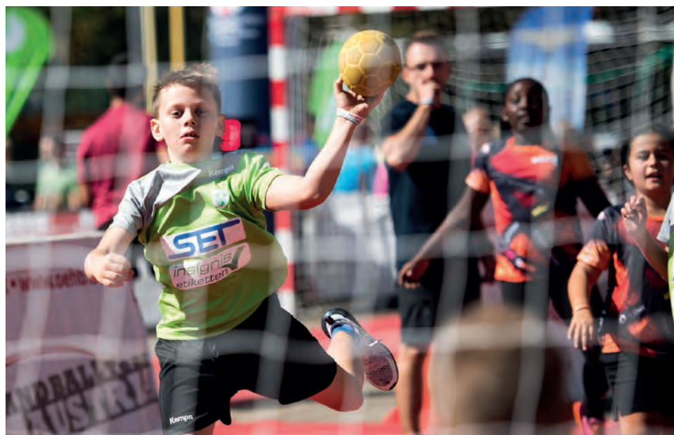
150 Mitmachstationen auf über 6 Mio. Quadratmeter.

winnspielen mit Preisen wie eine Reise zu den Olympischen Spielen 2020 nach Tokio für zwei Personen, VIP-Tickets für die Lotterien-Sporthilfe-Gala, ein VIP-Package für den Biathlon-Weltcup in Hochfilzen usw. kann ordentlich abgesahnt werden. Und jedem, dem auch das noch zu wenig ist, kann seinen Adrenalinspiegel zusätzlich bei einem Bungy-Sprung in 65 Meter Tiefe mächtig in Wallung bringen. Was wieder einmal beweist: SPORT BEWEGT und kann VIELES! – Nur nicht langweilen!