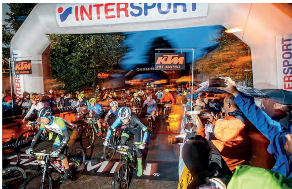
529 Marathon-Biker starten um 5 Uhr morgens in Bad Goisern