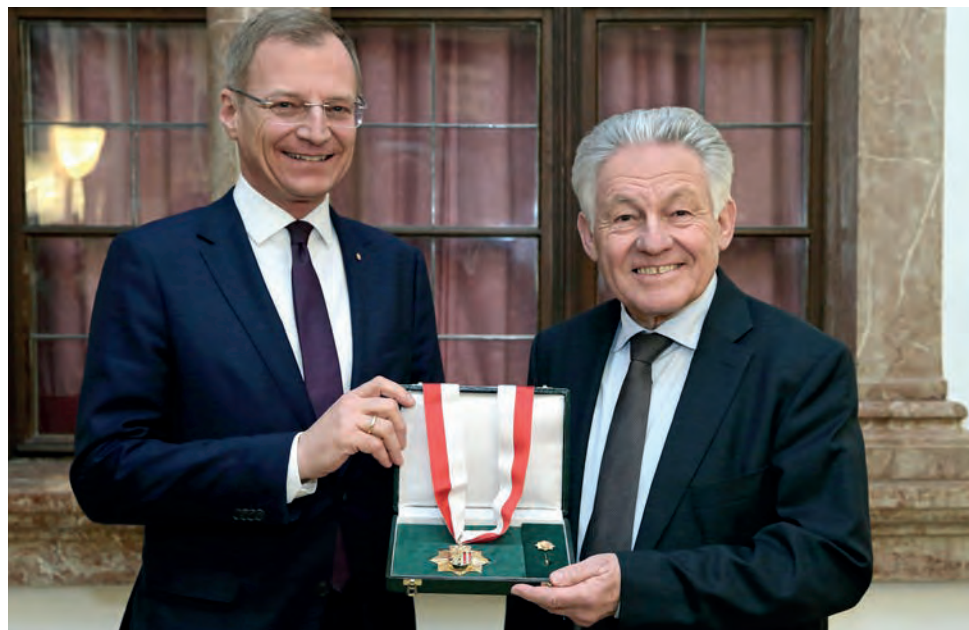
Goldenes Ehrenzeichen für Josef Pühringer.

nen Sportverbandes OÖ. Es ist vor allem dem unermüdlischen Einsatz des ehemaligen „Landesvaters“ – wie er von den OberösterreicherInnen gerne bezeichnet wird - zu verdanken, dass Oberösterreich bis heute als Sportland immer die Nase vorne hat und die Vereinskultur einen hohen Stellenwert besitzt. Angesichts der 2.500 Sportvereine und knappen 6.000 Sportstätten bietet das Land nicht nur für AthletInnen eine ausgezeichnete Infrastruktur, sondern kann Jahr für Jahr beachtliche Erfolge im Sport, nationalen wie internationalen, vorweisen.