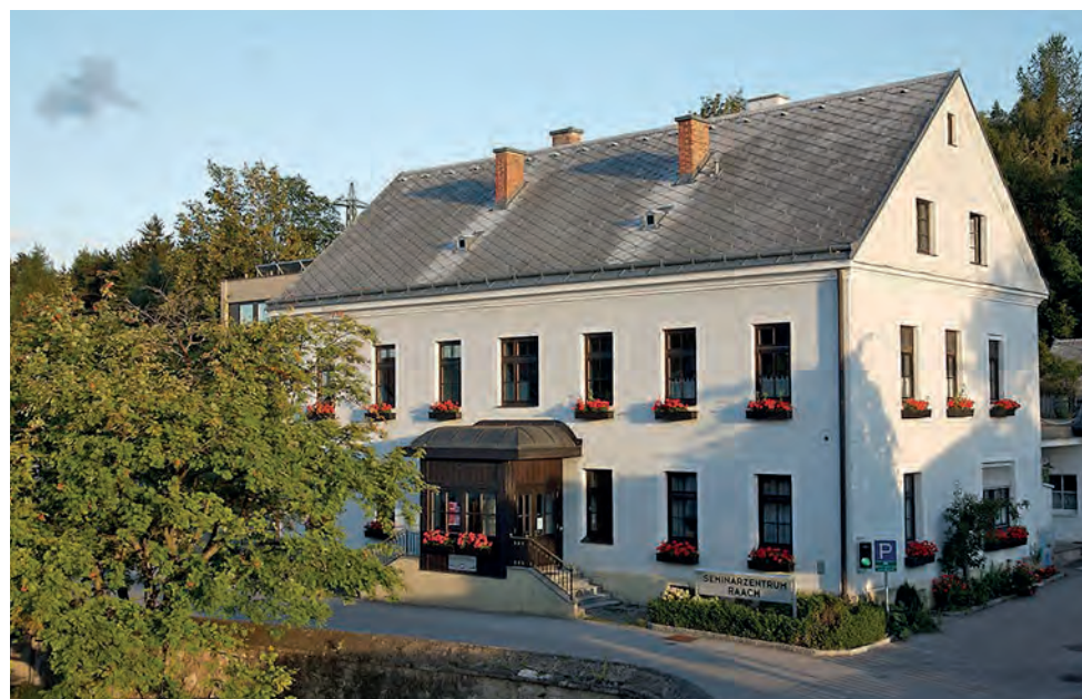
BSLH Raach - Plattform für Erlebnisse, Freundschaften und Lernen.