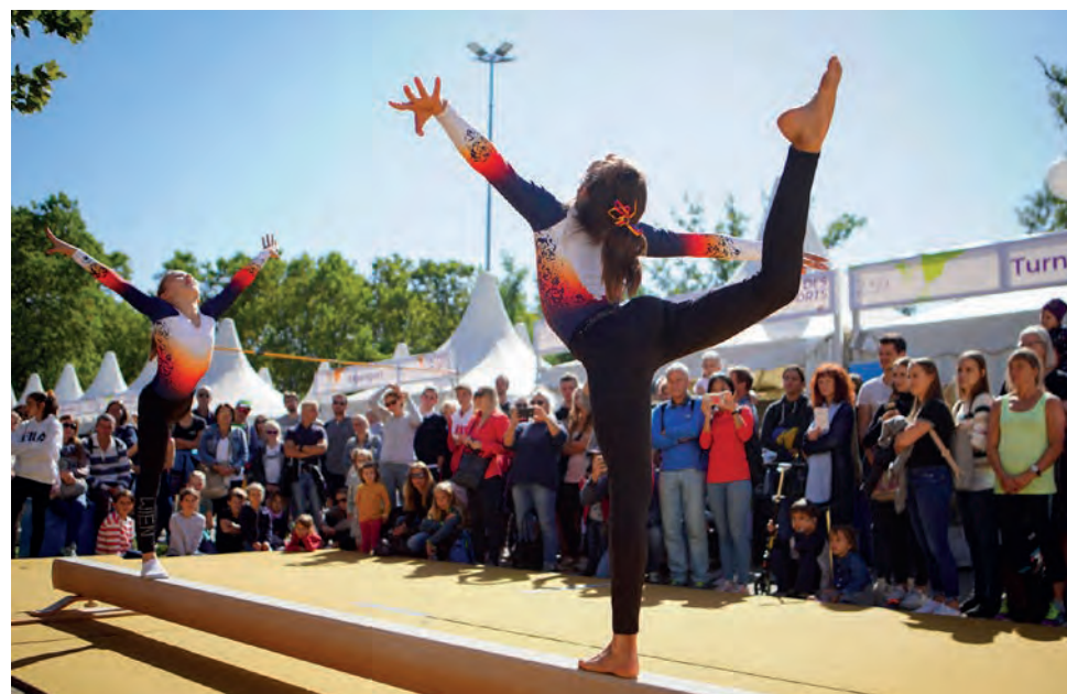
122 heimische Sportvereine betreuen die bewegungshungrigen Menschen.