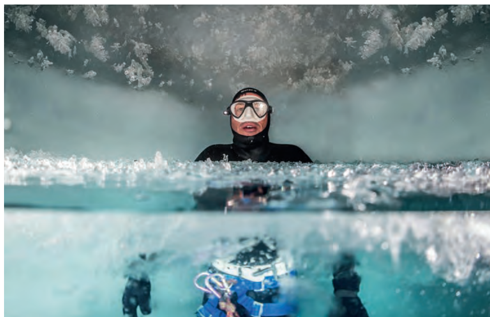
Redl taucht auf 3.200 Meter Seehöhe ohne Pressluftflasche...