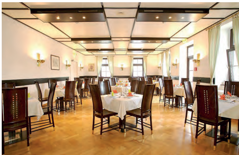
Im Speisesaal dominieren Wärme, Behaglichkeit und regionale Küche.