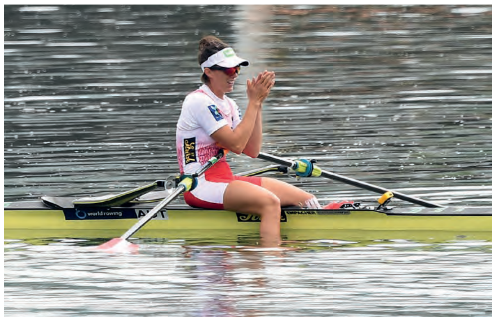
Im Mittelpunkt der WM steht die Platzierung für Tokio 2020.

sich die Veranstalter sowie zahlreiche freiwillige Helferinnen und Helfer bis hin zu den Ottensheimern ordentlich in die Ruder gelegt. So beraumt sich die Zahl der ehrenamtlich Tätigen auf sage und schreibe 300 Menschen, die neben nochmals so vielen Ordnerdiensten, Sicherheitskräften, Feuerwehrleuten und Sanitätern dem zehnköpfigen Organisationsteam unter die Arme greifen. Ein großes Dankeschön gilt daher all jenen, die diese Wettkampftage in Oberösterreich erst möglich gemacht haben!