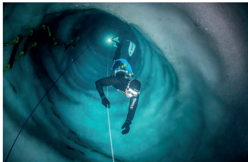
...23 Meter tief in den Eisschacht.