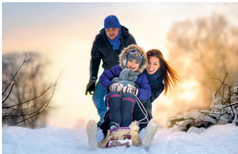
Rodelspaß für Groß und Klein.