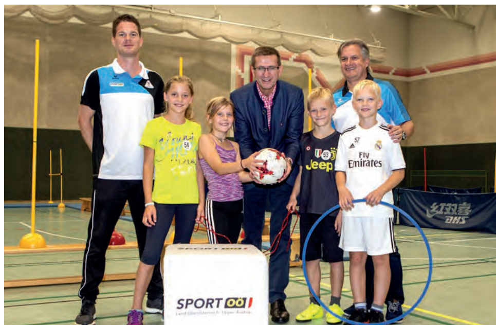
Landesrat Achleitner ist genauso begeistert wie die jungen TeilnehmerInnen.

die so die Gelegenheit erhalten, die Welt des Leistungssports besser kennenzulernen und sich umfassend über Möglichkeiten zur Talente-Förderung in den jeweiligen Sportarten zu informieren. Daneben sorgen auch eine Führung durch das Olympiazentrum sowie ein Mehrkampf für reichlich Spaß und Abwechslung. Als besonders interessantes und wichtiges Detail erweist sich zudem, dass bereits 85% der anwesenden Kinder in einem Sportverein in einer Sportart oder mehreren aktiv sind. Dies zeigt erneut, wie wichtig die Vereinsarbeit für die sportliche Zukunft unserer Jugend ist!