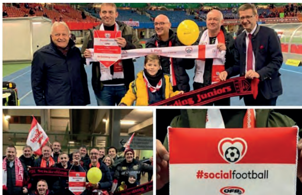
2. Platz für den ASVÖ Verein SK Schärading.

Der Social Football Award wurde vom ÖFB 2018 ins Leben gerufen und wird seitdem jährlich ausgeschrieben. Der Preis wird in drei Kategorien vergeben, zu denen auch die Rubriken „Fans“ und „Inklusion“ gehören. So will der ÖFB mit dieser Auszeichnung jene Menschen honorieren, die mit ihrem selbstlosen Engagement einen sozialen Beitrag im Fußball leisten und dabei eine große gesellschaftliche Verantwortung übernehmen sowie durch ihr Handeln zugleich Werte wie Respekt, Fairness und Zusammenhalt vermitteln.