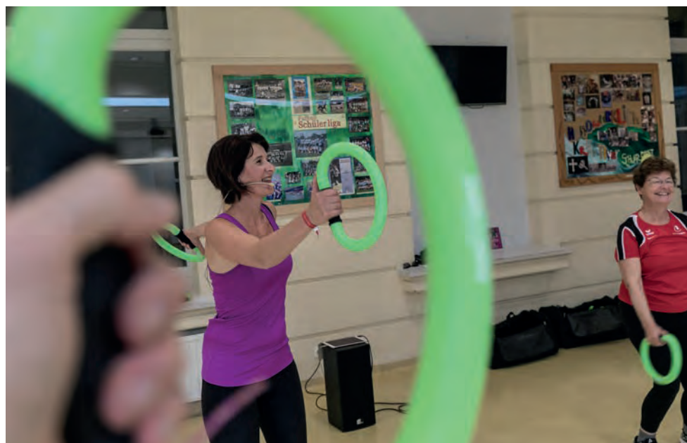
Regelmäßige Bewegung macht das Gehirn fit für den Alltag.