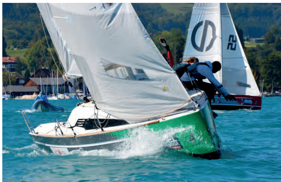
Sechs Jugendteams kämpfen bei besten Segelbedingungen.