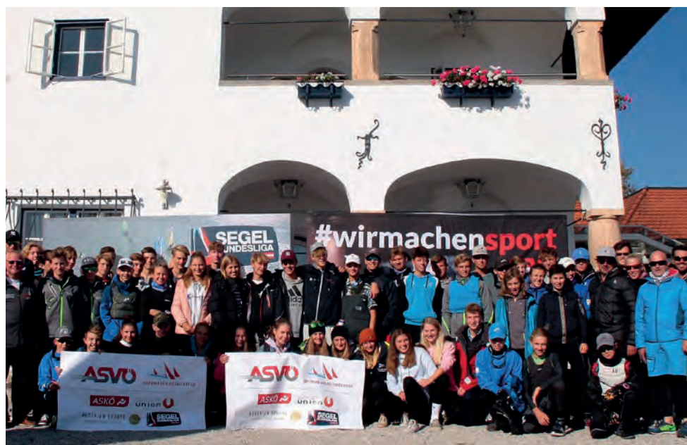
Begeisterte SeglerInnen bei der zweiten Auflage des OESV Jugendcups.