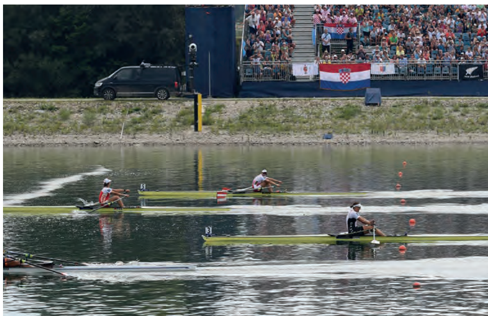
Über 25 Fernsehstationen übertragen dieses Event an 150 Mio. Zuseher.