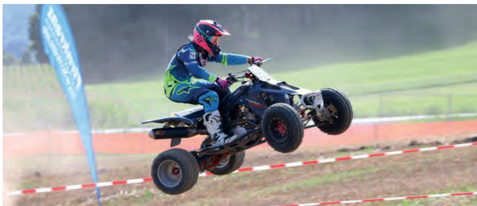
Duelle mit Racebuggies und Quads sind jedes Jahr Magnet für Motorsportbegeisterte.