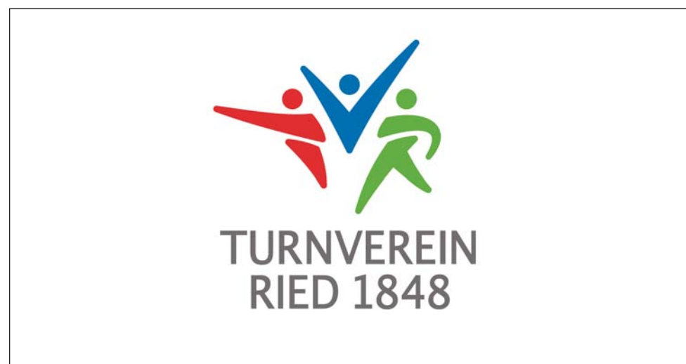
VORBILDLICH, DIE NEUORIENTIERUNG DES TV RIED: NEUE VERPACKUNG, NEUER INHALT; DENN WIE SAGT SCHON DER VOLKSMUND: WER NICHT MIT DER ZEIT GEHT, GEHT MIT DER ZEIT...

Am Augenfälligsten: Das neue Erscheinungsbild. Denn, so die neuen Rieder Vereins-Marketingvorgaben wie aus dem Lehrbuch: „zeitgemäßes Auftreten durch eine neue Werbelinie!“ Nicht nur an einer neuen „Verpackung“ wurde gearbeitet, auch an dem was drin ist. Und drin im neuen Turnverein Ried ist in Zukunft ein „Komplettanbieter für Turnen und Bewegung“. Man hat sich also breiter aufgestellt und will in Zukunft für die „Erhaltung der Gesundheit“ stehen sowie für eine „Vielzahl an sportlichen Betätigungen – vom Breitensport bis zum