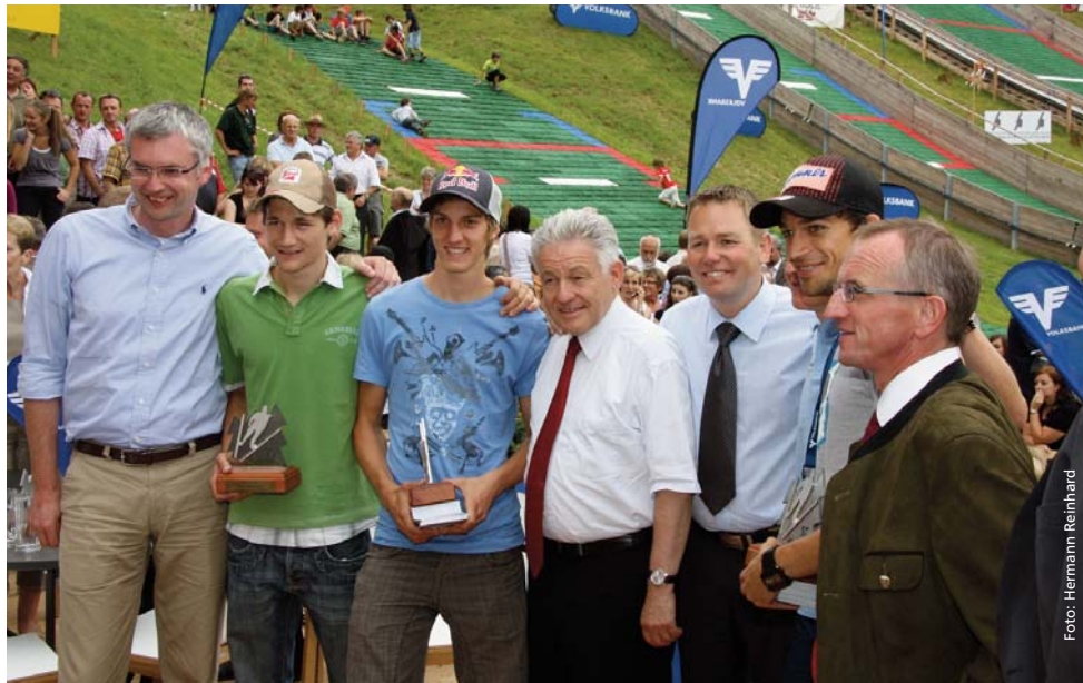
EINE INVESTITION FÜR DEN NACHWUCHS - DER NEUE ADLERHORST DES SC HÖHNHART, VIEL LOB UND ANERKENNUNG SPENDETE AUCH UNSER LANDESCHEF DR. JOSEF PÜHRINGER.

So gut wie Alles, was im österreichischen Skisprungsport Rang und Namen hat, sei es als Aktiver, ehemaliger Aktiver, sei es als Trainer, Funktionär – selbstverständlich auch höchste Prominenz aus Politik und Wirtschaft, ja die gesamte Region hat sich an jenem Wochenende im Juli 2009 am Rande des Kobernaußerwaldes die Ehre gegeben. Natürlich wurde auch gesprungen, von den „Alten“ etwa, um die eine oder andere Weite zu markieren – in erster Linie aber von den Jungen und ganz Jungen, vom Nachwuchs also, denn für diese wurde die Anlage ja gebaut. Zurecht stehe die Anlage heute hier, so Andreas Goldberger, weil beim Ski Club Höhnhart am besten und effizientesten gearbeitet werde. „Wir ersparen